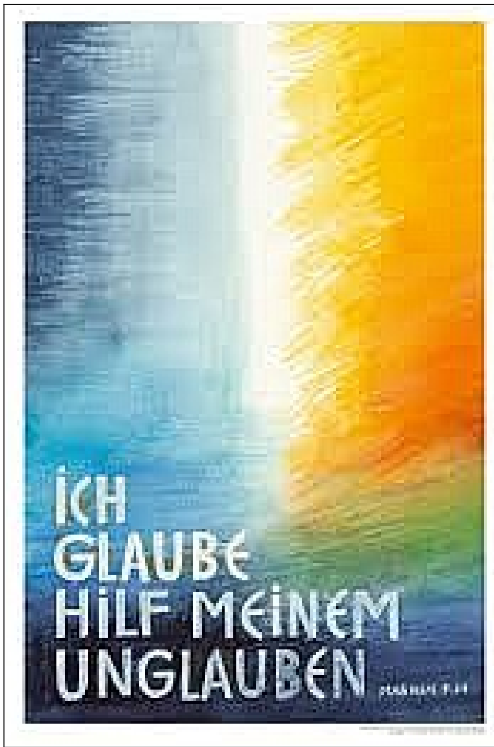
Jahreslosung 2020 – gestaltet von Andreas Felger