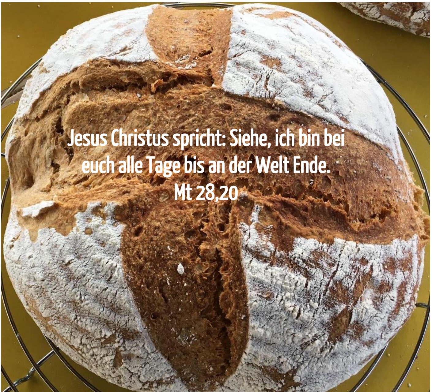
Das erste Brot aus dem neuen Holzbackofen am Gemeindezentrum