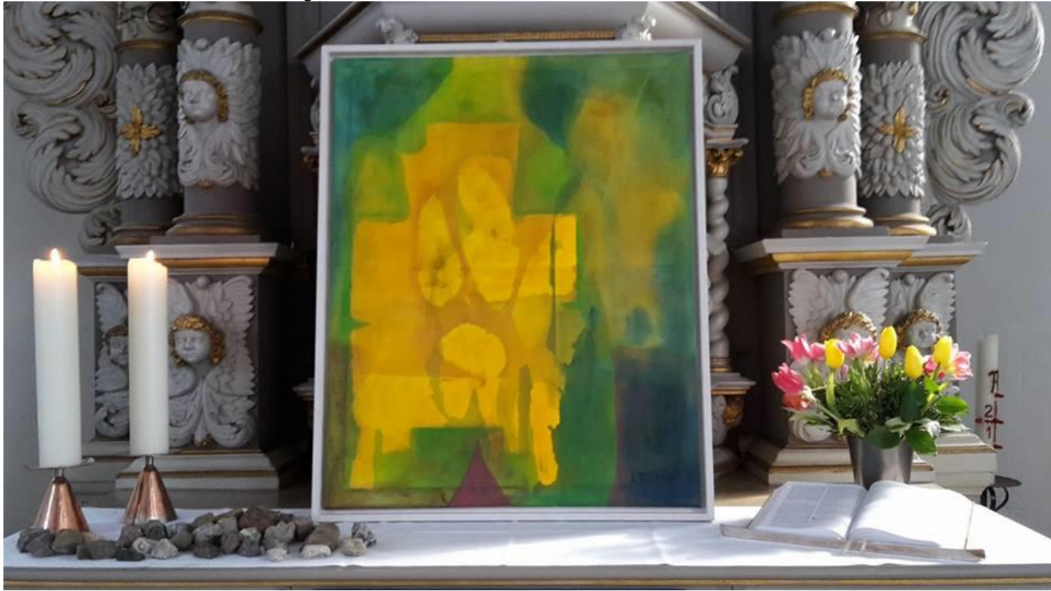
Bild aus der Reihe „Eidoformas – eine Variable für...“ auf dem Altar der Alten Kirche

Gottesdienst mit anschließender Finissage der Ausstellung K. Templin-Glees im Foyer des Gemeindezentrums Alte Kirche