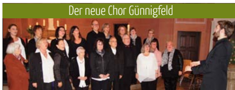
Der neue Chor Günnigfeld

Mit dabei ist auch der Günnigfelder Familientisch. Das ökumenische Team wird an einem Stand mit für die Verpflegung der Gäste sorgen. Die Vorbereitung dazu laufen auf vollen Touren. Am Donnerstag, 13. Juni gibt es beim wöchentlichen Familientisch im Wichernhaus ab 12.30 Uhr eine Generalprobe für den besonderen Einsatz beim Kirchentag. Team und Gäste können dann erleben, wie es eine Woche später in der Dortmunder Innenstadt in der Nähe der Reinoldikirche zugehen und schmecken wird.